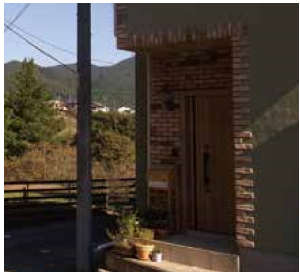
玄関扉 | 交換 外壁 | 塗装