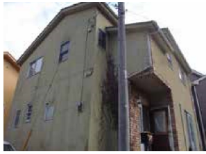
外観 | 施工前