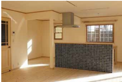
リビング | 漆喰塗り・床張り替え・二重サッシ交換