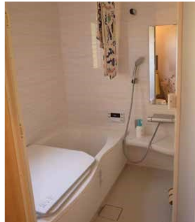
風呂場 | 設備取り替え