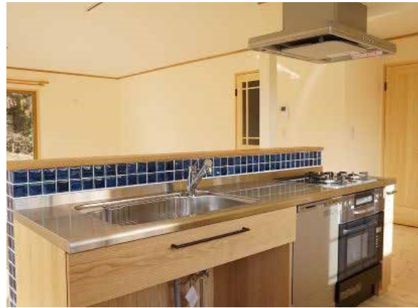
キッチン | 設備取り替え